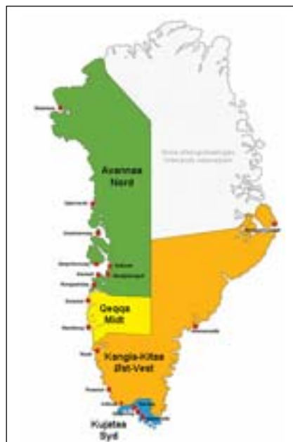
KANUKOKA-p nittartagaanit asseq tigusaq

Qeqqata kommuunerujussuaq: Sisimiut aamma Maniitsoq.